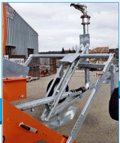
Relevage traineau anti canardage