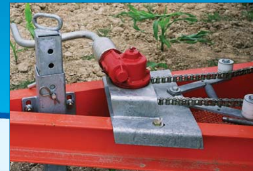
Rotation tourelle mécanique