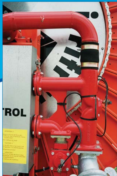
Tubulure alimentation avec vanne intégrée