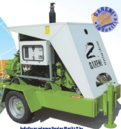
Application sur motopompe thermique 80 m 3 /h à 12 bar